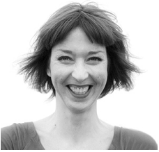
Sonja Röhrig Kreation, Design und Grafik