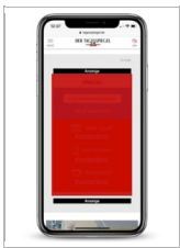
Mobile Werbeformate Understitial Ad