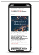
Morgenlage Wirtschaft Bild-Text Anzeige

Der Newsletter Tagesspiegel Morgenlage Wirtschaft bietet Entscheidern einen Überblick über die wichtigsten Themen des Tages in Form einer Nachrichten- und Presseschau. Die Redaktion mit Standorten in Berlin und Los Angeles analysiert die Themenlage und versendet den Newsletter werktags ab 5 Uhr morgens.