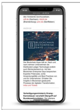
Morgenlage Politik Bild-Text-Anzeige

Quelle: Profilierungsumfrage in der Tagesspiegel Morgenlage durchgeführt von Pollytix. Erhebungszeitraum: 22.-23.09.2015, n=1060.