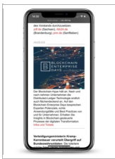
Morgenlage Wirtschaft Bild-Text Anzeige

Der Newsletter Tagesspiegel Morgenlage Wirtschaft bietet Entscheidern einen Überblick über die wichtigsten Themen des Tages in Form einer Nachrichten- und Presseschau. Die Redaktion mit Standorten in Berlin und Los Angeles analysiert die Themenlage und versendet den Newsletter werktags ab 5 Uhr morgens.