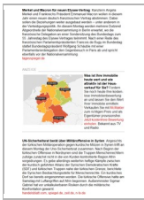
Morgenlage Wirtschaft Bild-Text Anzeige

Der Newsletter Tagesspiegel Morgenlage Wirtschaft bietet Entscheidern einen Überblick über die wichtigsten Themen des Tages in Form einer Nachrichten- und Presseschau. Die Redaktion mit Standorten in Berlin und Los Angeles analysiert die Themenlage und versendet den Newsletter werktags ab 5 Uhr morgens. Tagesspiegel Morgenlage Wirtschaft hat eine Reichweite von mehr als 20.000 Abonnenten.