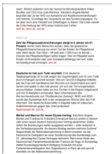
Morgenlage Politik Textanzeige