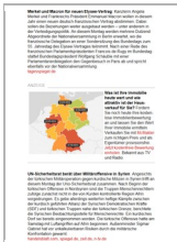
Morgenlage Politik Bild-Text-Anzeige

Quelle: Profilierungsumfrage in der Tagesspiegel Morgenlage durchgeführt von Pollytx. Erhebungszeitraum: 22.-23.09.2015, n=1060.