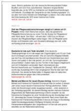
Morgenlage Wirtschaft Textanzeige