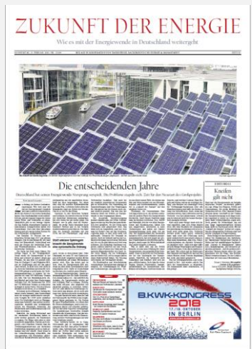
Beispiel: Beilage Feb. 2018

Weitere Formate auf Anfrage. Preis Mo.– Fr., 4c. Die Preise sind nicht rabattfähig oder rabattbildend, jedoch AE-fähig, zzgl. gesetzlicher MwSt. Ein Anzeigenauftrag kann bis spätestens zum Tag des Anzeigenschlusses storniert werden. Danach fällt die Auftragssumme in voller Höhe an. Weitere Informationen und unsere AGBs finden Sie auf www.anzeigenpreise.tagesspiegel.de