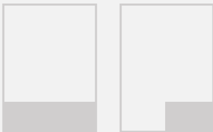
Streifen B 370,5 x H 100 mm Postkarte B 184,5 x H 100 mm